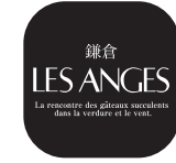
鎌倉レ・ザンジュ 公式アプリ

ポイントの有効期限は最終ご購入日から 1 年です。 1 年以内にお買物を繰り返せばポイントは失効しません。